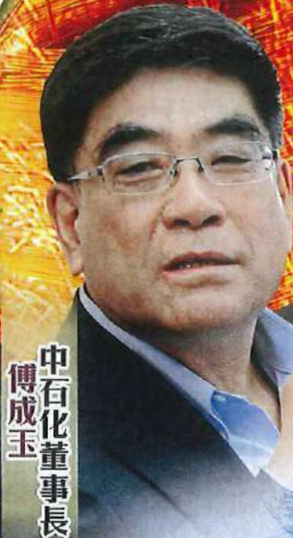
中石化董事長 傅成玉