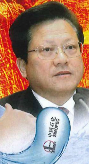
鞍鋼集團董事長 張慶寧