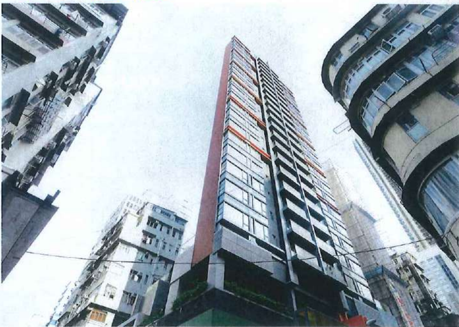
▲圖中間是位於佐敦的「匯萃」，樓高25層，共有66個單位。

再加上旗下位於佐敦官涌的單幢樓新盤「匯萃」，亦已進入準備預售階段，若一旦開售，相信銷情向旺，可望帶動股價回復朝氣。