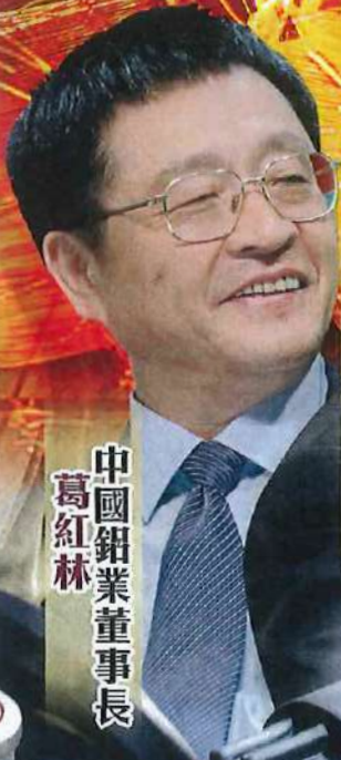
中國鋁業董事長 葛紅林

ISSUE 493 2015年04月23日 www.capital-weekly.com